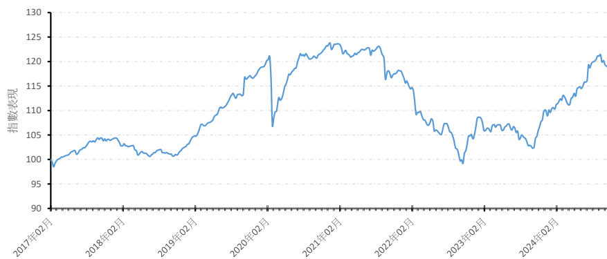
A 美元 (累積)