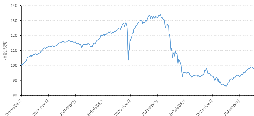
A 美元 (分派)