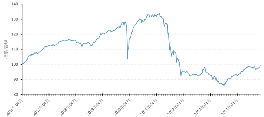
A 美元 (分派)